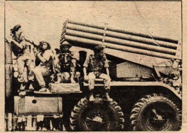
Sovyet silahları ve Küba askerleri Angola'da; Yeni Çarların emperyalist askeri makinası Angola ve Afrika halklarına karşı.

Hatırlanacağı gibi Sovyet sosyal-emperya - listleri 1975 ortalarında Angola kurtuluş örgüt - leri arasındaki iç savaşa müdahale ederken, "Güney Afrika kuvvetlerinin istilasına karşı Angola'nın yardımına koştuklarını" öne sürmüşlerdi . Gerçekte ise, Sovyet-Küba kuvvetleri, Güney Afrikalılara karşı hemen hiç savaşmadılar. On - lar bütün güçlerini savaşan taraflardan birini ezmeye, yüz bin Angolalıyı katletmeye ve 1 milyon insanı yurdundan sürmeye yönelttiler. Angola'nın güneyindeki sınırlı bazı bölgelere girmiş o -