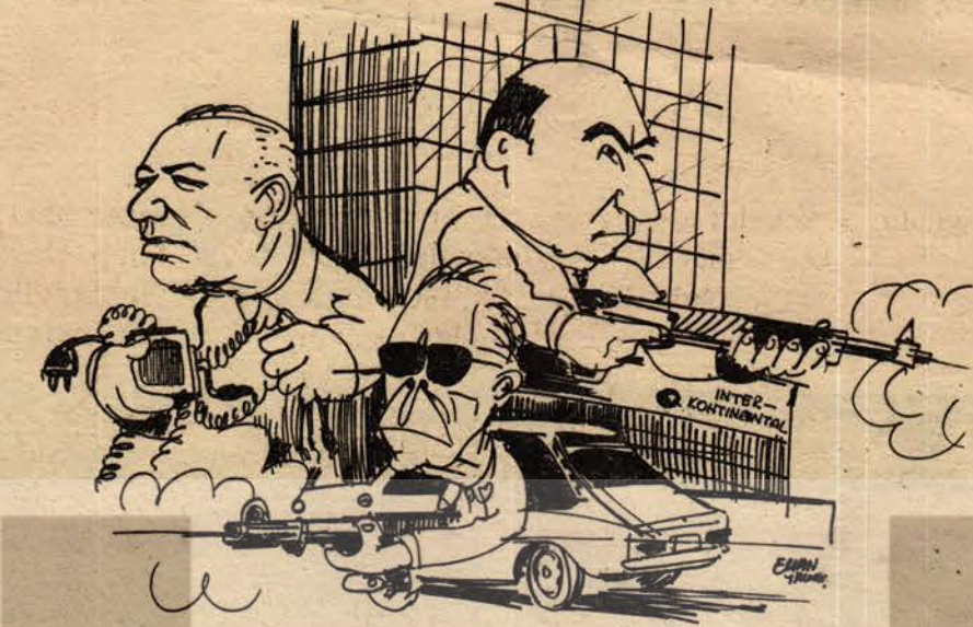
"TÜSDEK" ELEMANLARI İŞBAŞINDA

12 Mart kliği "alt yapı" "devrim tabanı", "Türk halk-